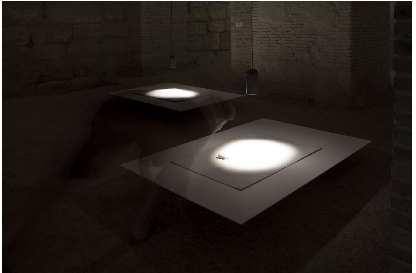
STILLS OF PEACE (exposición colectiva), Museo Capitolare, Atri (Italia), 2015.

... pasar de la narración de hechos al relato de significados profundos, de la luz exterior a la iluminación interior, de las personas y las cosas a la soledad y el silencio.