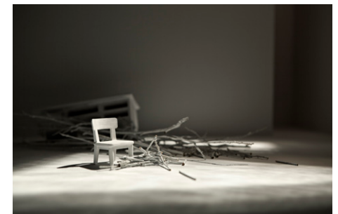
Serie CERCAR AL SILENCIO, 2010/2014. Impresión digital de tintas pigmentadas sobre papel de algodón.