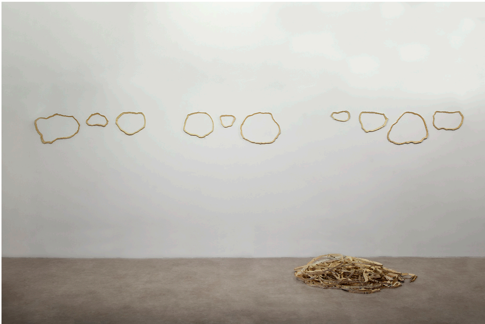
LA PIEL DE LAS IDEAS, 2020. Madera y yeso.