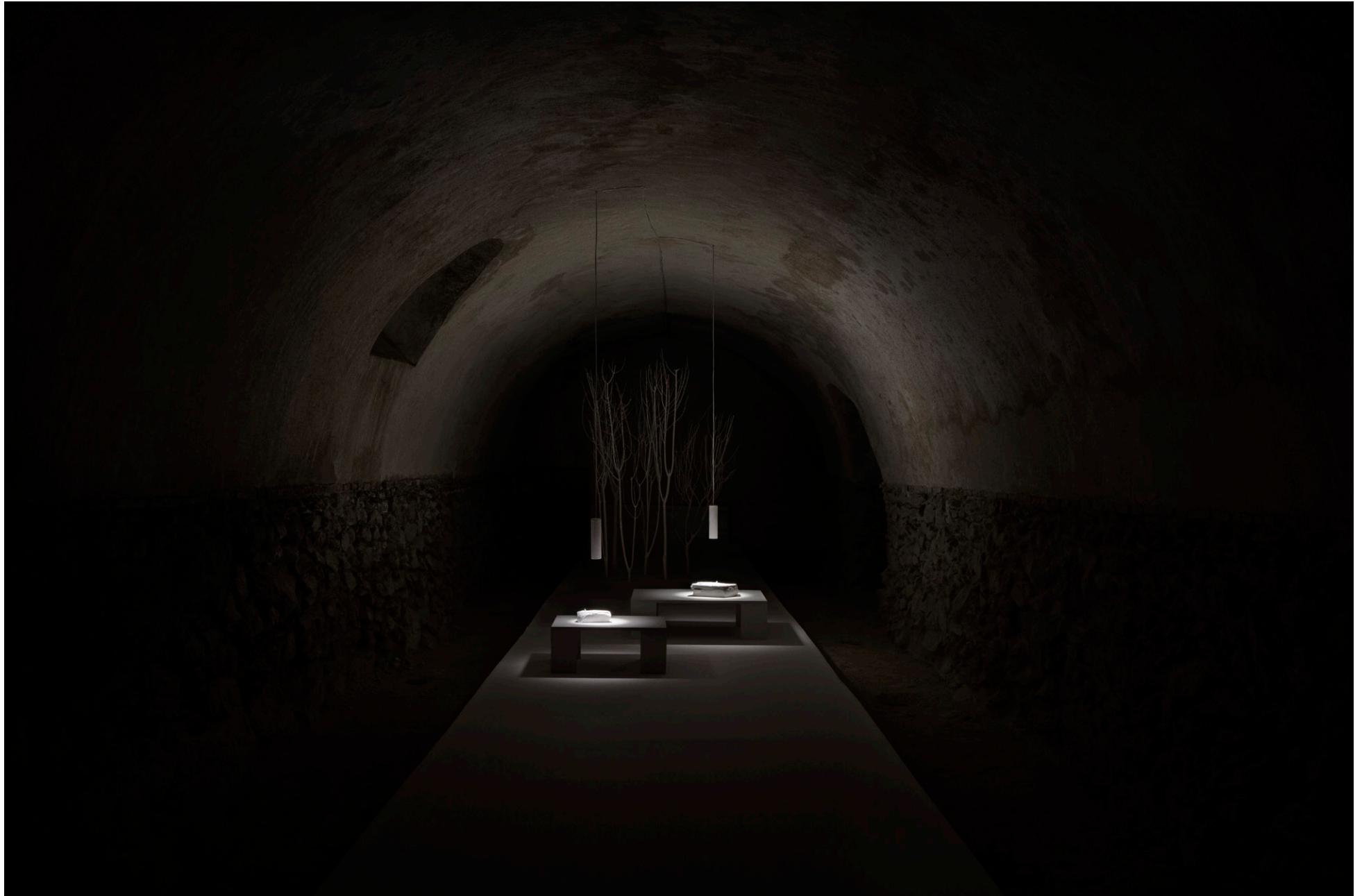
SANGRAR LUZ (exposición individual), Museo de Arte Contemporáneo de Castilla-La Mancha, Ciudad Real, 2018.