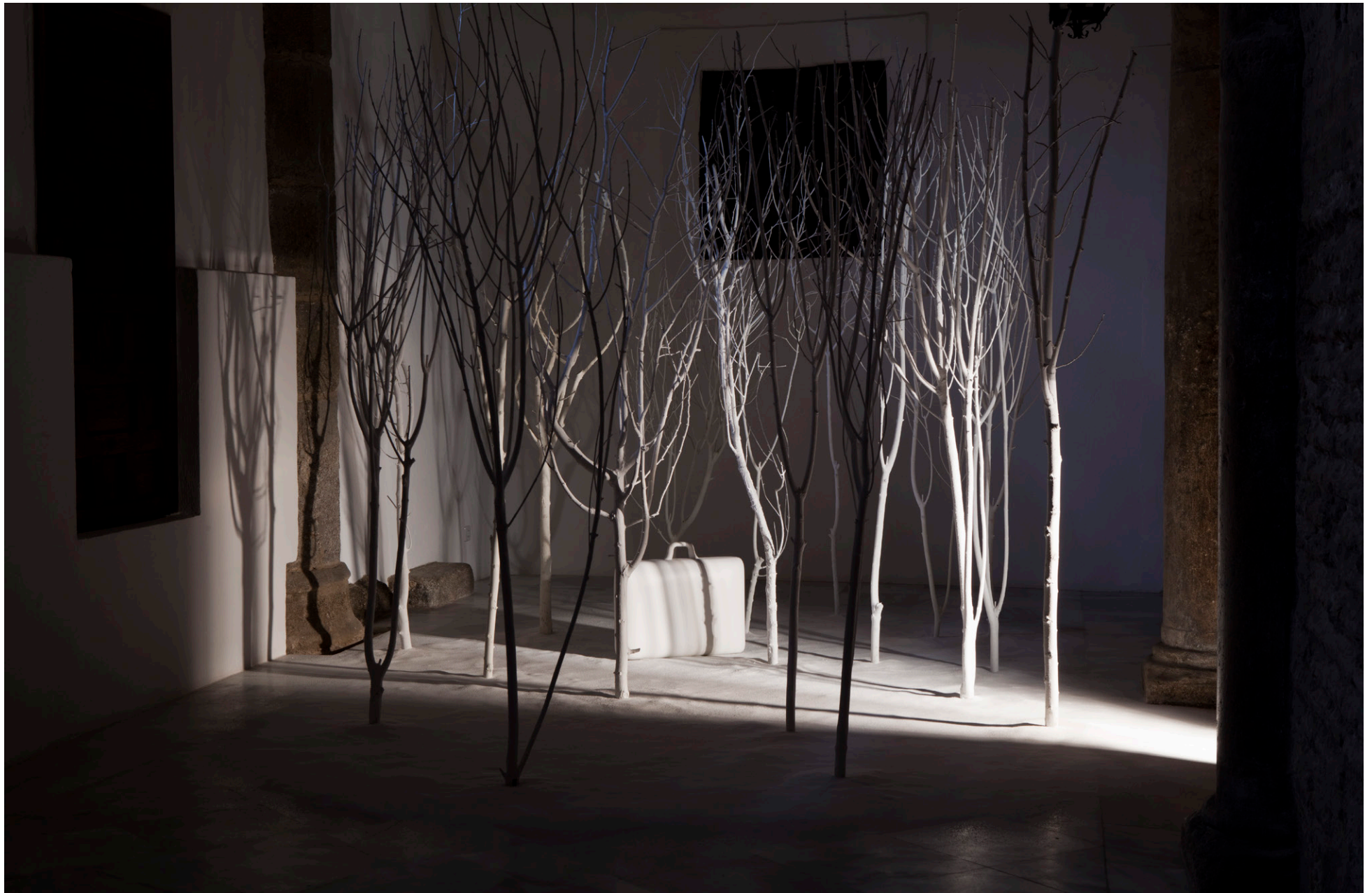
ESPACIOS DE REGENERACIÓN, zaguán del Convento de Santa Clara, Toledo, 2016.