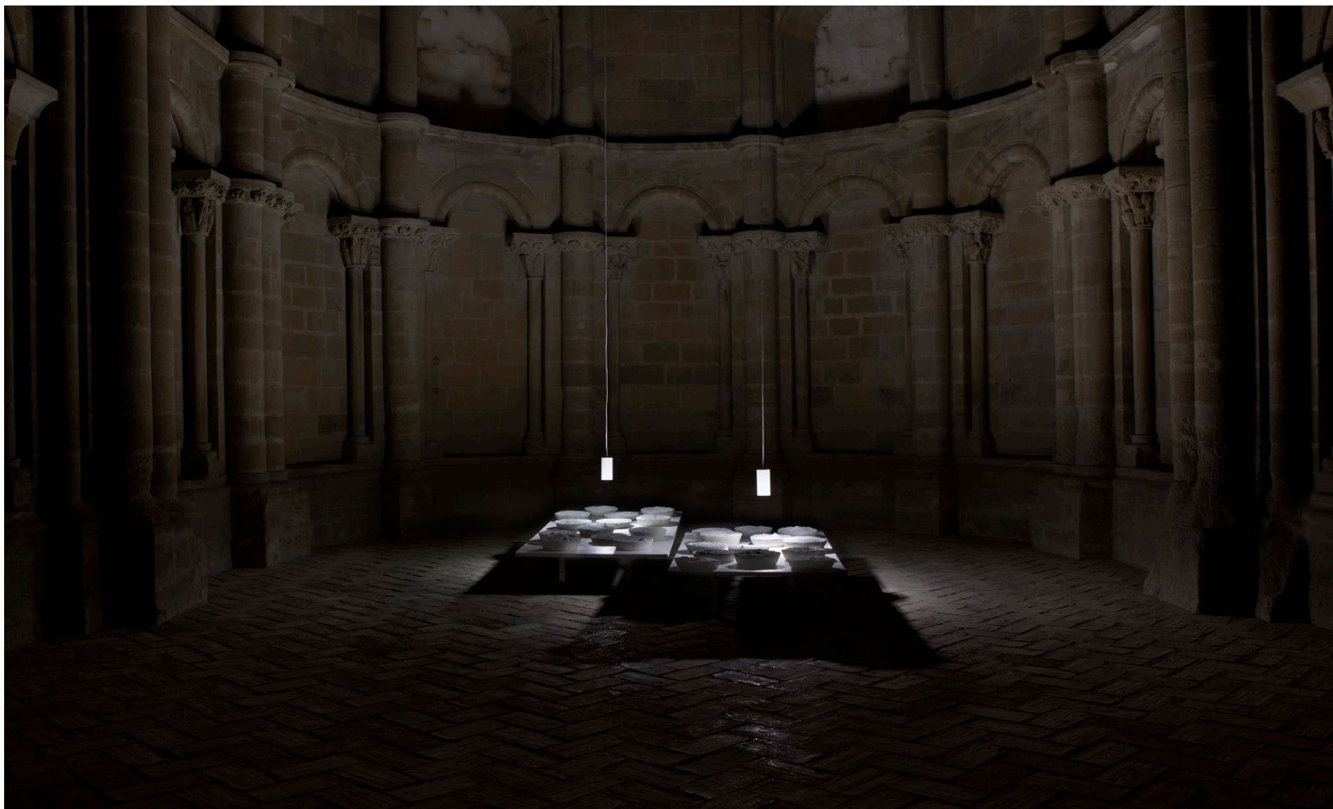
LA CONSTRUCCIÓN DEL SILENCIO (exposición individual), Sala de Doña Petronila, Museo de Huesca, 2018.