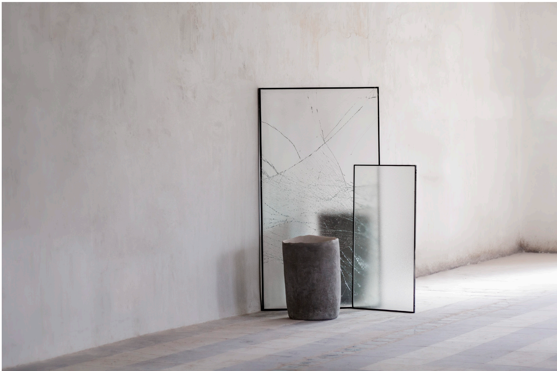
SUSPENDERSE EN EL VACÍO, 2020. Cristal y cemento.