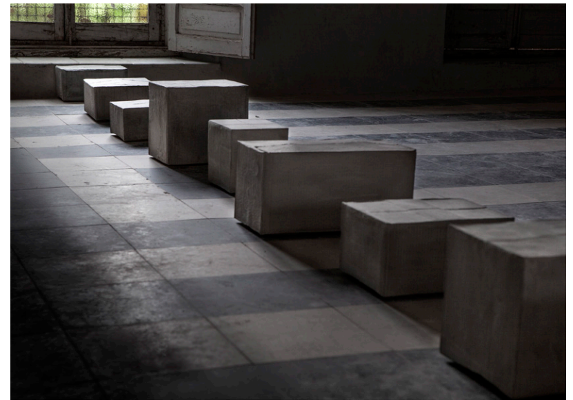
VACIAMIENTOS, edificio Enfermería, Universidad de Cartilla-La Mancha, Toledo, 2020.