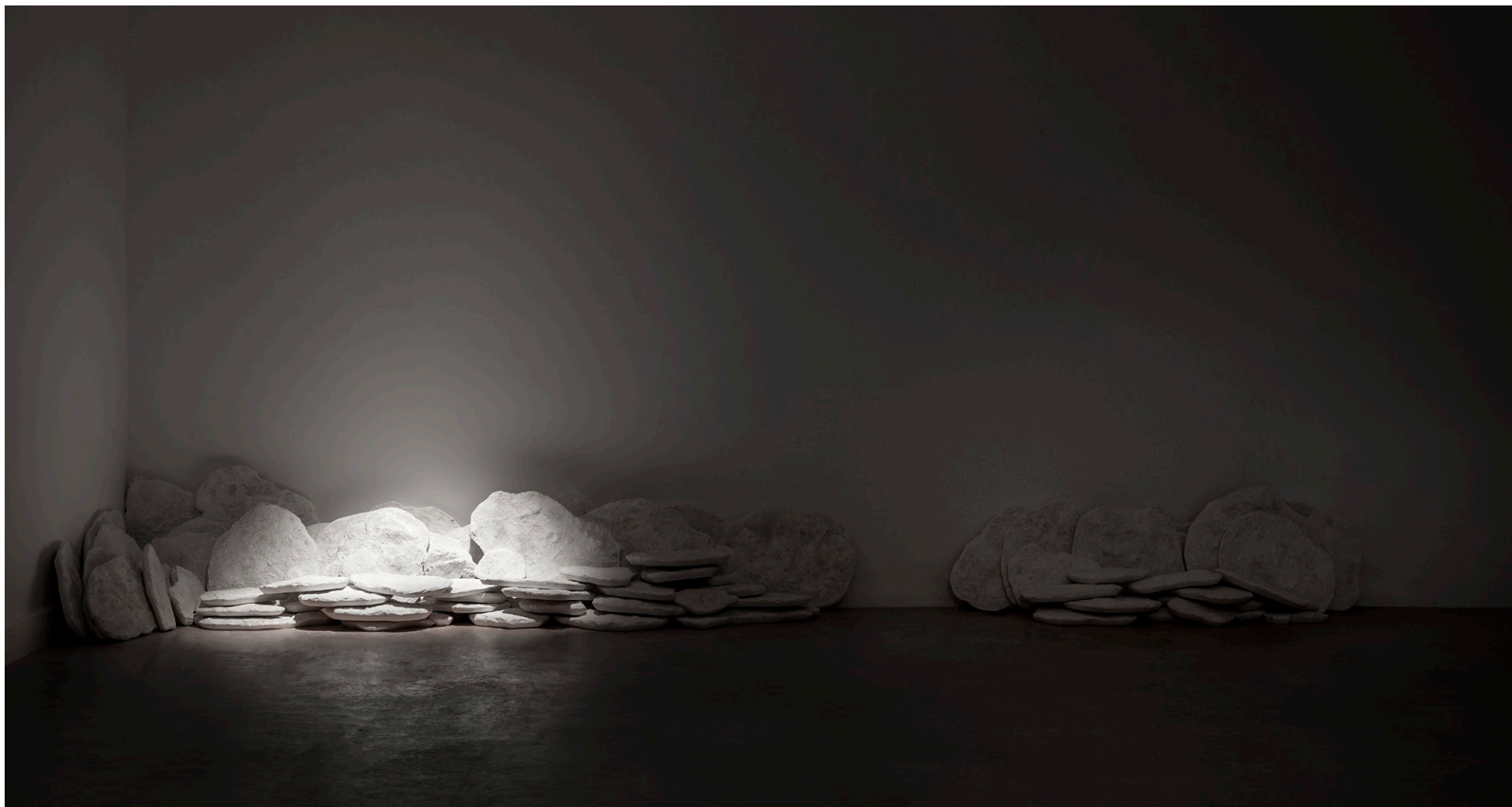
IDENTIDADES, 2019. Yeso, madera y luz.