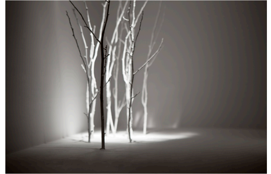
Serie SOLEDADES, 2014/2017. Impresión digital de tintas pigmentadas sobre papel de algodón.