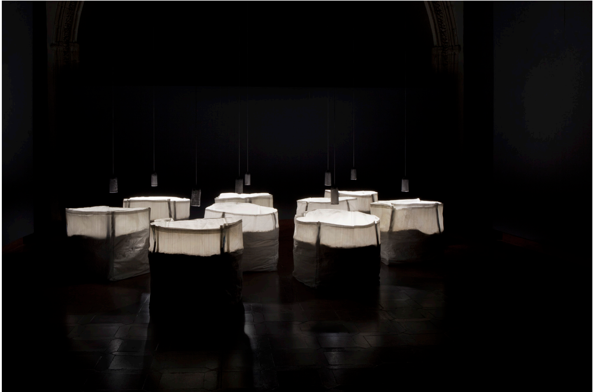
LÍMITES, 2017. Tela plástica, yeso, barro, pintura, luz y sonido.