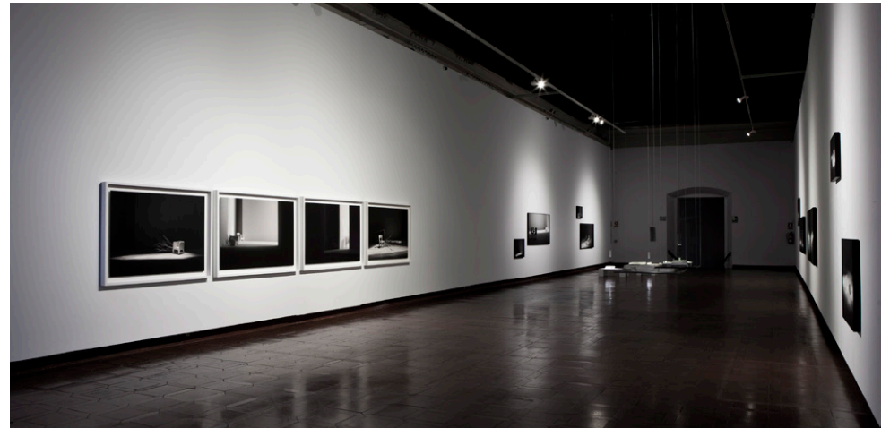
SANGRAR LUZ (exposición individual), Museo de Santa Cruz, Toledo, 2017.