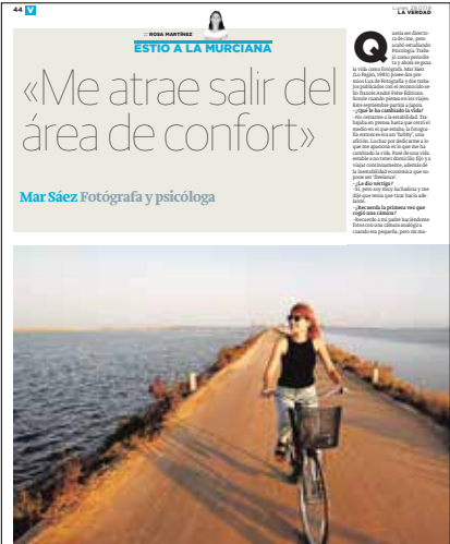
La Verdad. 29-07-2019. Enlace .