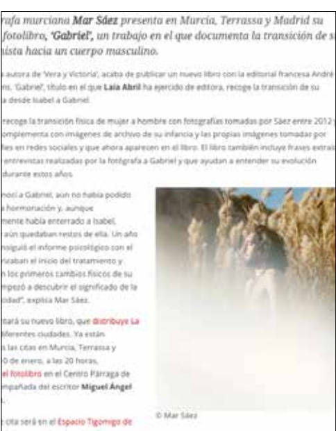
Clavoardiendo Magazine. 7-01-2019. Enlace .