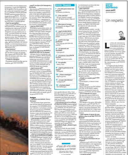
La Verdad. 29-07-2019. Enlace .