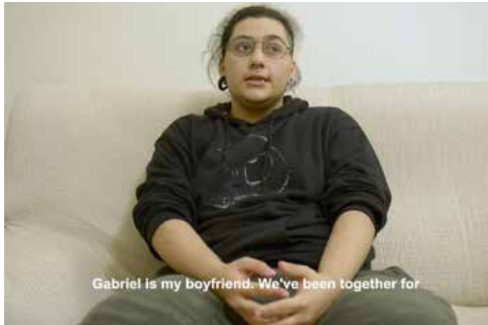
Entrevista a la pareja de Gabriel: enlace