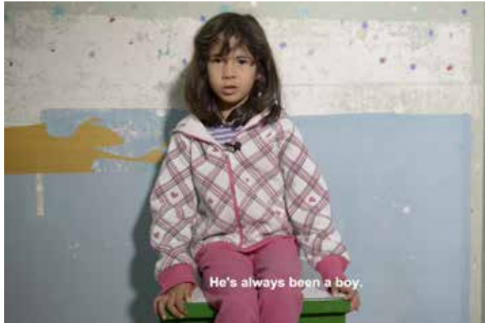
Entrevista a la hermana de Gabriel: enlace