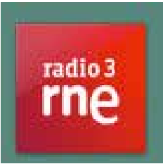
Entrevista en “Hoy empieza todo” 01-02.2019