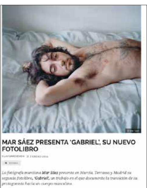
Clavoardiendo Magazine. 7-01-2019. Enlace .