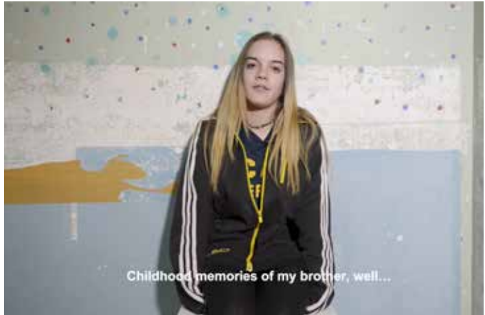
Entrevista a la hermana de Gabriel: enlace