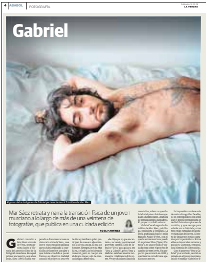
LA VERDAD. 12-01-2019. Enlace .