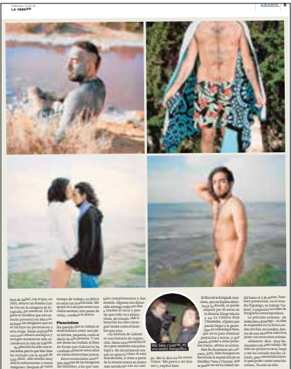
LA VERDAD. 12-01-2019. Enlace .