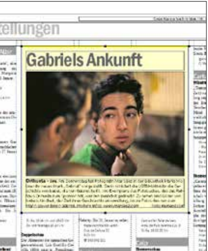
La Verdad. 29-07-2019. Enlace .