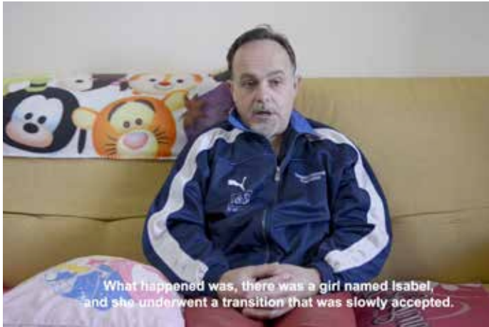
Entrevista al padre de Gabriel: enlace