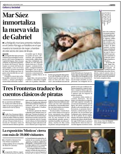
LA VERDAD. 12-01-2019. Enlace .