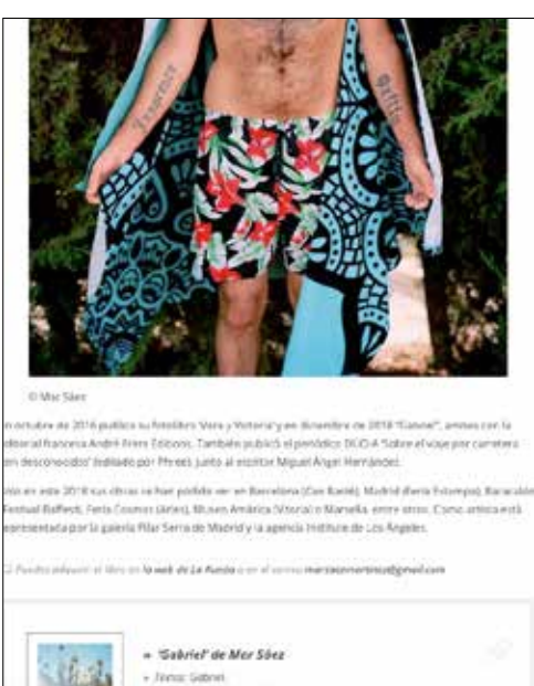
Clavoardiendo Magazine. 7-01-2019. Enlace .